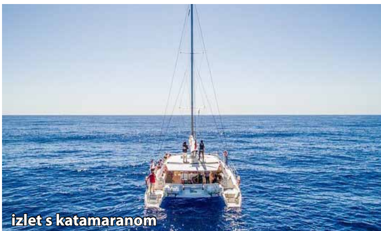
izlet s katamaranom

Pot bomo nadaljevali v vožnjo v notranjost otoka čez skrivnostno planoto Paul da Serra. Gre za edino pravo planoto na Madeiri, ki s svojo odprto, skoraj nadrealistično pokrajino preseneti in prikaže povsem drugačen obraz otoka. Od tam se bomo spustili proti obali vse do mesta Porto Moniz, ki slovi po svojih naravnih vulkanskih kamnitih bazenih, izklesanih v črni lavi. Ob pogledu na razburkani Atlantski ocean si bomo tam privoščili kosilo ob morju. Po kosilu bomo pot nadaljevali proti São Vicenteju, prijetni gorski vasi na severni strani otoka. Vožnja po severozahodni obalni cesti je prava paša za oči, saj se ob poti slapovi spuščajo po strmih skalnih stenah neposredno v globoko modro morje. Polni vtisov se bomo ob koncu dneva vrnili v hotel, prosto za počitek in sprostitev. Nočitev.