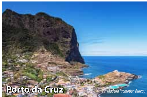
Porto da Cruz