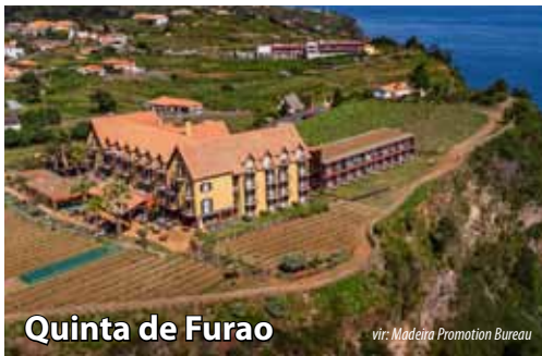
Quinta de Furao

Kasneje bomo obiskali mesto Santana - slovi po svojih prepoznavnih trikotnih hišah s pisanimi fasadami in tradicionalnimi slamnatimi strehami, ki so postale simbol podeželske arhitekture Madeire. Sprehod med temi hiškami ponuja vpogled v bogato kulturno dediščino otoka in življenja domačinov v preteklosti. Po obisku Santane nas čaka kosilo v restavraciji ob razgledni točki Quinta do Furão, kjer bomo obdani z vinogradi uživali v čudovitih razgledih na razgibano severovzhodno obalo. Popoldne se bomo peljali mimo Porta da Cruz, očarljivega kraja s slikovitim zalivom, ki je skrit v vzhodnem pobočju mogočnega hriba Penha d'Águia. V kraju se bomo ustavili v lokalni destilarni, si ogledali tradicionalni postopek pridelave ruma in ga tudi poskusili. Ob koncu dneva bomo obiskali še slikovito obmorsko mestece Machico, ki ga krasí lepa peščena plaža. Sledi vožnja po otoku do hotela in nočitev.