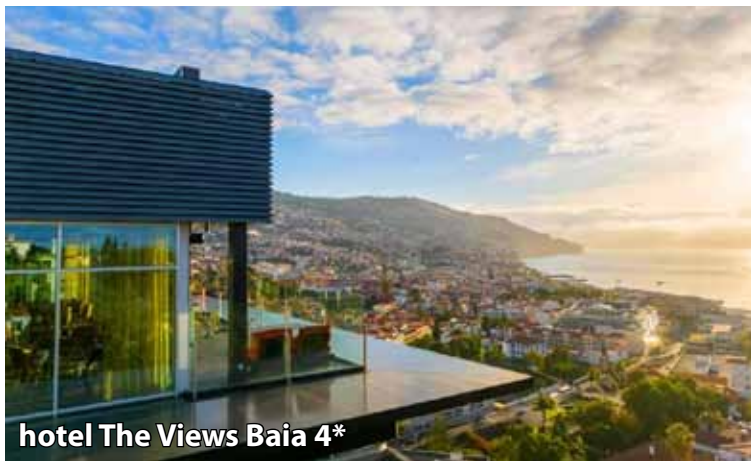
hotel The Views Baia 4*