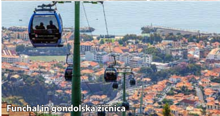
Funchal in gondolska žičnica