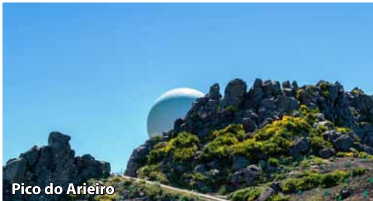
Pico do Arieiro

Nedelja, 4.10.: v jutranjih urah se bomo iz Maribora odpeljali proti dunajskemu letališču. Po prihodu na letališče bomo opravili letališke obveznosti, nato pa nas čaka opoldanski direktni let proti Madeiri. Po pristanku na otoškem letališču sledi krajša vožnja do Funchala. Nabirali bomo prve vtise, saj nas bo pot vodila po obmorski cesti s pogledom na Atlantski ocean. Prihod do hotela in namestitvev. Za naše bivanje smo izbrali hotel The Views Baia 4* v središču mesta, v bližini restavracij, trgovin ter marine. Hotel je namenjen bivanju odraslih, gostom pa ponuja bar, restavraciji, zunanji bazen s teraso za sončenje, notranji bazen, wellness center ... Prosti čas za počitek, nočitev.