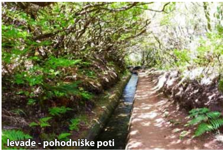
levade - pohodniške poti