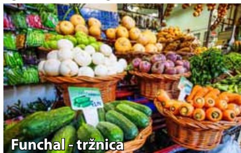
Funchal - tržnica

Torek, 6.10.: po zajtrku se bomo v spremstvu lokalnega vodnika odpravili na ogled največjega mesta na otoku, Funchala. Ogled bomo začeli z obiskom živahne kmečke tržnice, kjer bomo občudovali barvite stojnice z eksotičnim sadjem, zelenjavo, cvetjem in svežimi ribami. Tržnica ponuja pristno doživetje lokalnega utripa, ob tem pa bomo imeli priložnost poskusiti tudi različno sadje, ki uspeva na otoku. Nato se bomo z gondolo povzpeli do Monteja, očarljive vasice nad mestom, obdane z bujnimi vrtovi. V kraju stoji cerkev Gospe Montejske, pomembno romarsko središče Madeire. Možno bo obiskati botanični vrt Monte Palace Tropical Garden (doplačilo) ter se sprehoditi skozi skrbno urejene parke z bogato zbirko rastlin z vsega sveta. Adrenalinski navdušenci se boste lahko popeljali z pletenimi sankami - edinstvena, približno deset minutna vožnja z dvema tradicionalnima spremljevalcema (doplačilo). Po vrnitvi v Funchal se bomo sprehodili po mestnih ulicah in se prepustili mestnemu vrvežu. Sledilo bo pozno kosilo v lokalni restavraciji, nato pa bomo obiskali vinoteko Blandy's Wine Lodge v središču mesta. Predstavili nam bodo zgodovino vinogradništva na Madeiri ter za nas pripravili degustacijo lokalnega vina. Povratek v hotel, nočitev.