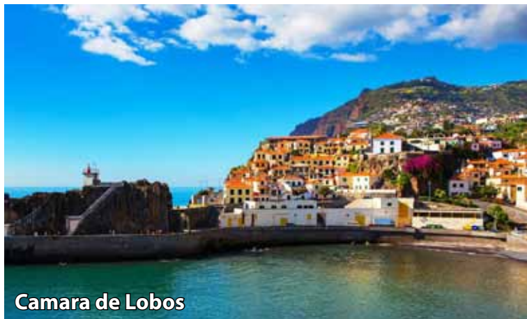
Camara de Lobos