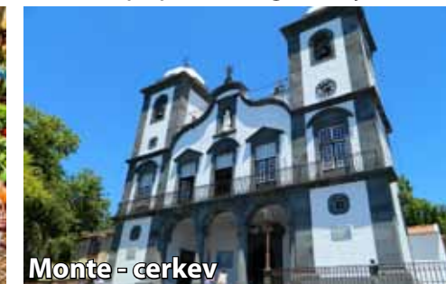
Monte - cerkev