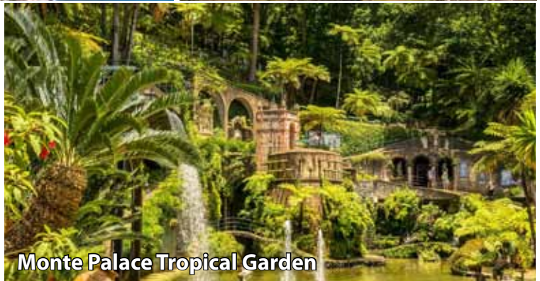
Monte Palace Tropical Garden

Torek, 6.10.: po zajtrku se bomo v spremstvu lokalnega vodnika odpravili na ogled največjega mesta na otoku, Funchala. Ogled bomo začeli z obiskom živahne kmečke tržnice, kjer bomo občudovali barvite stojnice z eksotičnim sadjem, zelenjavo, cvetjem in svežimi ribami. Tržnica ponuja pristno doživetje lokalnega utripa, ob tem pa bomo imeli priložnost poskusiti tudi različno sadje, ki uspeva na otoku. Nato se bomo z gondolo povzpeli do Monteja, očarljive vasice nad mestom, obdane z bujnimi vrtovi. V kraju stoji cerkev Gospe Montejske, pomembno romarsko središče Madeire. Možno bo obiskati botanični vrt Monte Palace Tropical Garden (doplačilo) ter se sprehoditi skozi skrbno urejene parke z bogato zbirko rastlin z vsega sveta. Adrenalinski navdušenci se boste lahko popeljali z pletenimi sankami - edinstvena, približno deset minutna vožnja z dvema tradicionalnima spremljevalcema (doplačilo). Po vrnitvi v Funchal se bomo sprehodili po mestnih ulicah in se prepustili mestnemu vrvežu. Sledilo bo pozno kosilo v lokalni restavraciji, nato pa bomo obiskali vinoteko Blandy's Wine Lodge v središču mesta. Predstavili nam bodo zgodovino vinogradništva na Madeiri ter za nas pripravili degustacijo lokalnega vina. Povratek v hotel, nočitev.