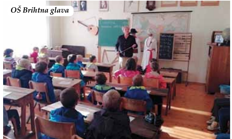
OŠ Brihtna glava