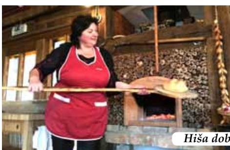
Hiša dobrega kruha