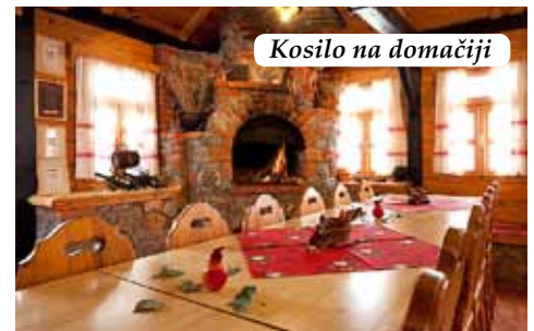
Kosilo na domačiji