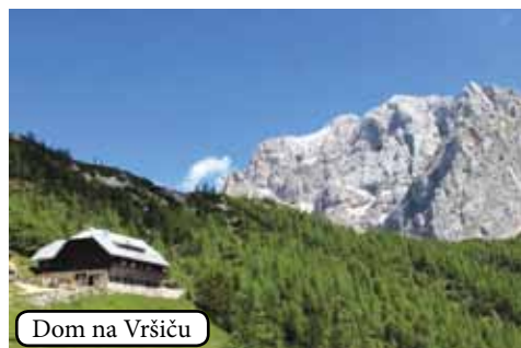
Dom na Vršiču