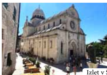
Izlet v Šibenik