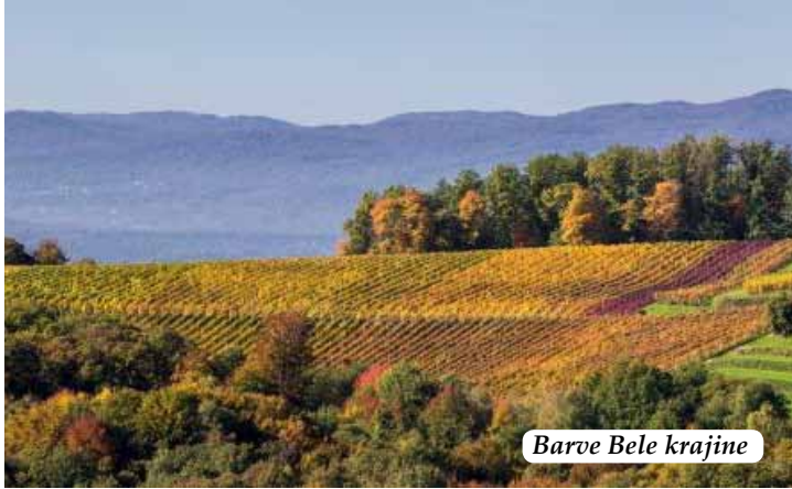
Barve Bele krajine

Ob vznožju kočevskih gozdov in Gorjancev, v objemu reke Kolpe se razprostira Bela krajina. Ta kraška pokrajina z globokimi vrtačami, belimi brezami in belo narodno nošo, ki je njen razpoznavni znak, popotnika prijazno pozdravi in pogosti z dobrotami iz domače kuhinje in kozarčkom rujnega vina.