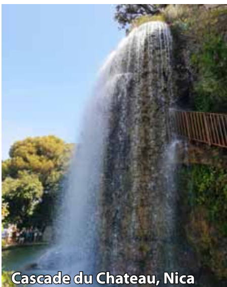
Cascade du Chateau, Nica

Torek, 28.4.: zajtrk v hotelu, prosti čas za sprehode, obisk katerega od muzejev, nakupe in razvajanje brbončic v katerem od množice lokalov, ki jih ponuja Nica. Tisti najpogumnejši boste morda tudi vsaj malo zakorakali med valove azurnega morja. V večernih urah poletimo proti Dunaju, povratek v Maribor ponoči.