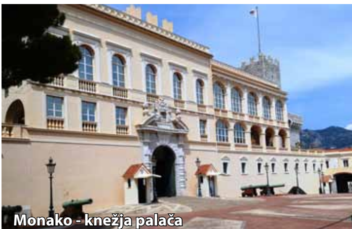
Monako - knežja palača

Nedelja, 26.4.: zajtrk v hotelu, nato pa se z avtobusom odpeljemo na celodnevni izlet. Začeli ga bomo z obiskom Antibesa, ki je bil ustanovljen v 5. stoletju pod imenom Antipolis. Mesto je edino na Azurni obali, obdano z obzidjem. Obiskali bomo Fort Carré, ki nudi čudovit razgled na mesto in največjo marino na Mediteranu. Sprehodili se bomo po starem mestnem jedru in obiskali zanimivo provansalsko tržnico, ki poteka vsak dan zjutraj. Naša naslednja postaja bo Cannes, kamor se bogati, slavni in lepi vračajo prav vsako leto. Cannes